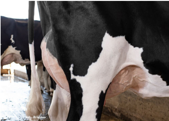
PROGENESIS OUTL WINTERBERRY DAM